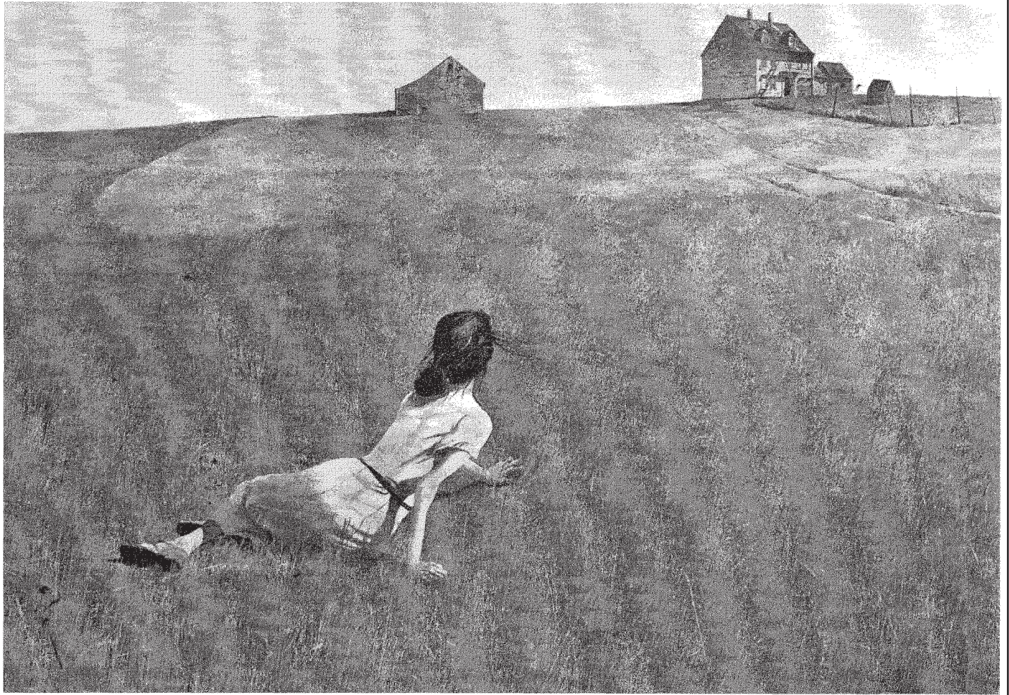
Andrew Wyeth, «Il mondo di Christina», 1948, New York, MoMA; sotto, «la casa della vita» di Mario Praz.