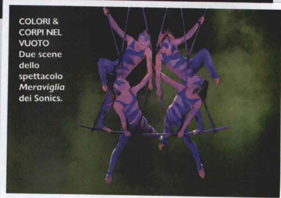
COLORI & CORPI NEL VUOTO Due scene dello spettacolo Meraviglia dei Sonics.