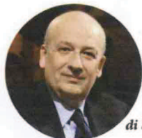
di Sandro Bondi