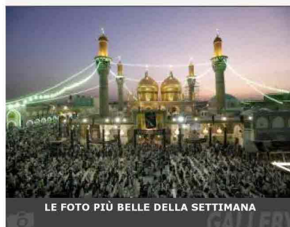
LE FOTO PIÙ BELLE DELLA SETTIMANA