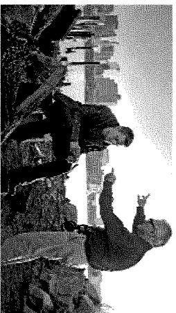
THE DEPARTED Scorsese parla con Leonardo DiCaprio sul set del film del 2006. Nel cast anche Jack Nicholson

Ritaglio stampa ad uso esclusivo del destinatario, non riproducibile.