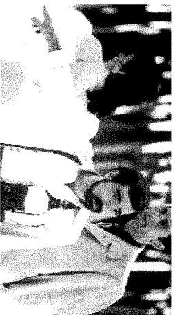
NEW YORK NEW YORK Scorsese spiega le inquadrature sul set del film del 1977 con Liza Minnelli e Robert De Niro