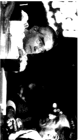
CASINO Martin Scorsese insieme a Robert De Niro sul set del film del 1995 con Sharon Stone e Joe Pesci