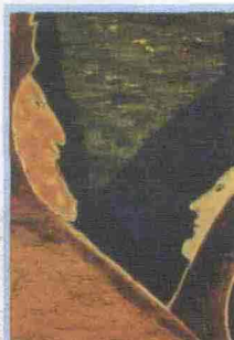
Opera di Tagore