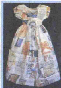
L'abito della Magnabosco