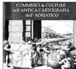
Commerci e culture nell'antica cartografia dell'Adriatico Marzia Merlonghi Maria Brandozzi

grafiche segue da vicino scoperte e innovazione delle altre scienze, ciò trova riscontro nelle rappresentazioni sempre più fedeli dei vari territori. Ma ancora di più, ed è questo il significato della mostra, esse dimostrano le profonde, intercon-