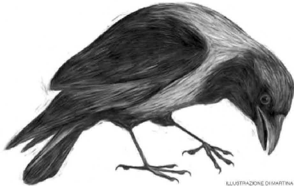
ILLUSTRAZIONE DI MARTINA MERLINI