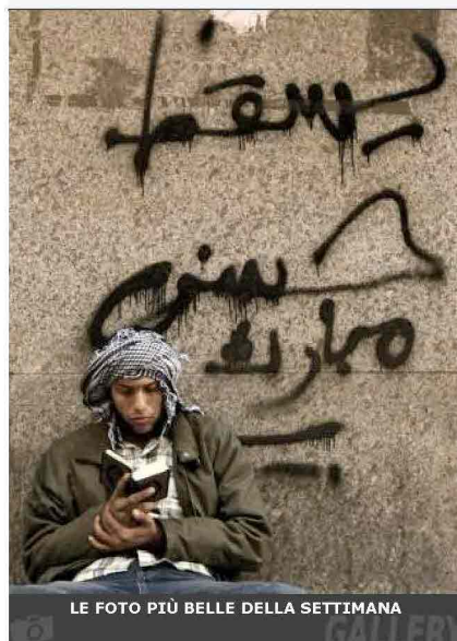
LE FOTO PIÙ BELLE DELLA SETTIMANA