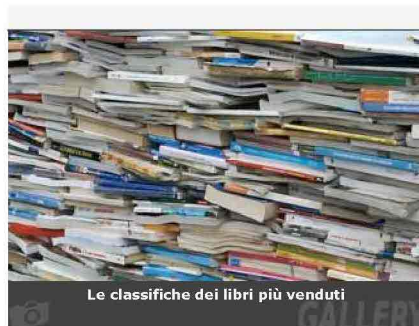
Le classifiche dei libri più venduti

Devi aver fatto log-in per inserire un commento.