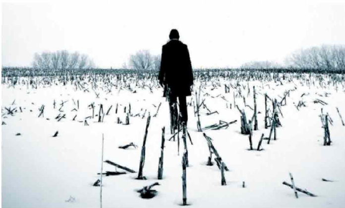
Dove sono andati a finire i soldi: particolare della copertina

Scrivi qualcosa, pubblicalo in terza pagina, raccoglilo in volume e stampalo. La condanna a cui è stato sottoposto il racconto italiano nella seconda metà del Novecento è riconducibile più o meno a questo: la prosa breve si è trasformata in un escamotage per placare gli appetiti degli editori (e la vanità dei grandi autori). E il risultato si è avvicinato molto a una fiera strapaesana.