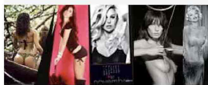
I NOSTRI CALENDARI