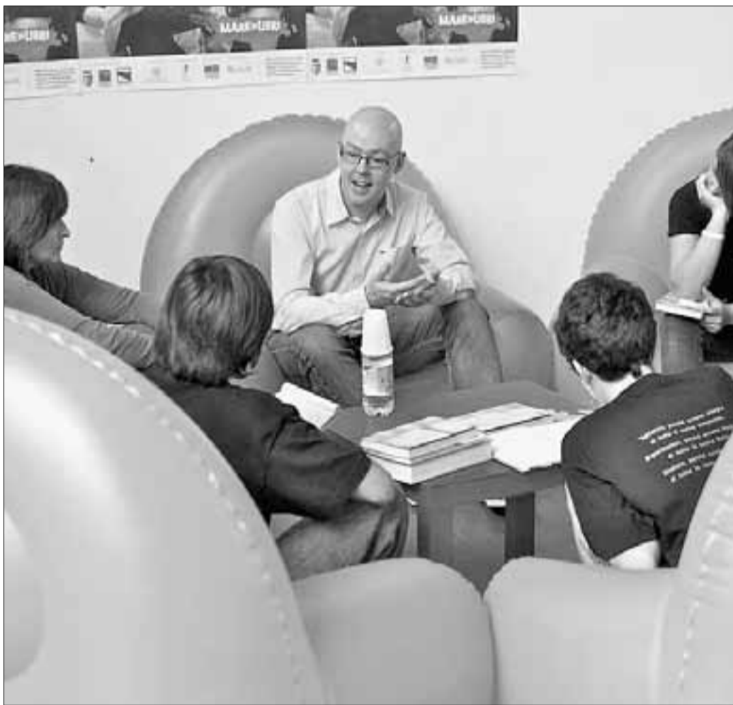
All'edizione 2010 di "Mare di Libri" John Boyne intervistato dalla Redazione Ragazzi

John Boyne, Celia Ress, Aidan Chambers, Anne-Laure Bondoux, Marie-Aude Murail, Todd Strasser, Dominic Barker e molti altri. Importante, come sempre, la presenza di ospiti del panorama letterario e cul-