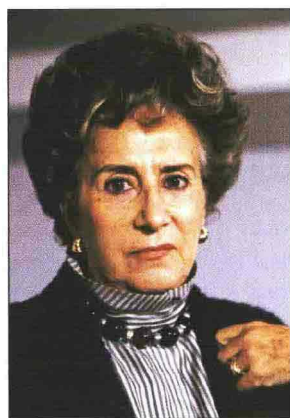
CENTENARIO Nel 2011 si celebrano i 100 anni dalla nascita di Cederna tra saggi e ristampe