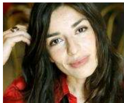
Sabrina Impacciatore, 38 anni

Chianciano Terme (Siena), 27 agosto 2010 - Il 3, 4 e 5 settembre, a Chianciano Terme, sarà inaugurata la prima edizione di Attorstudio - Le facce, la scrittura, le storie . Protagonisti dell'occasione saranno Pupi Avati, Sabrina Impacciatore, Giorgio Pasotti, Sergio Rubini, Giulio Scarpati, Domenico Starnone. Spettacolo, intrattenimento e riflessioni presso la Sala Fellini del Villaggio Termale. Ingresso gratuito.