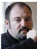
Camilleri &amp; Lucarelli