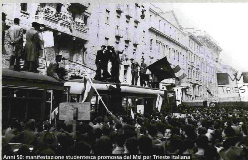
Anni 50: manifestazione studentesca promossa dal Msi per Trieste italiana

È DI NUOVO IN LIBRERIA AUTOBIOGRAFIA DI UN PICCHIATORE FASCISTA SCRITTO NEL '76 DA UN FASCISTA DIVENTATO DI SINISTRA IN CARCERE