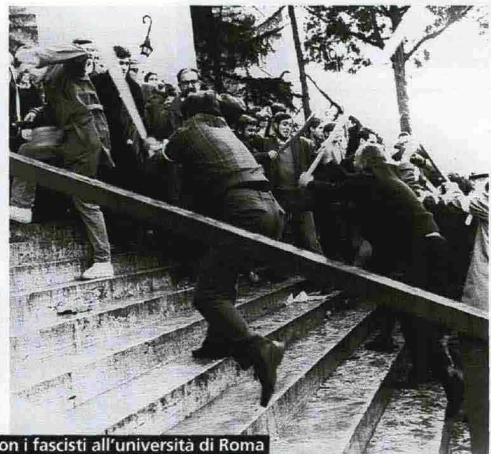
1968: scontri con i fascisti all'università di Roma