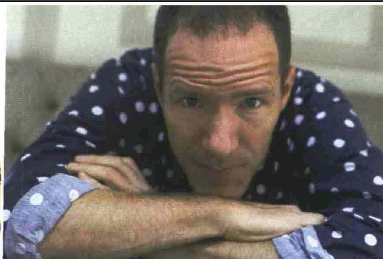
Rick Moody, scrittore-star americano, 47 anni.