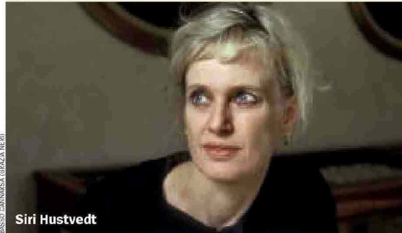
BASSO: DANNESEA (GRAZIA NERI)

Le novità editoriali, a cura di Maria Sepa