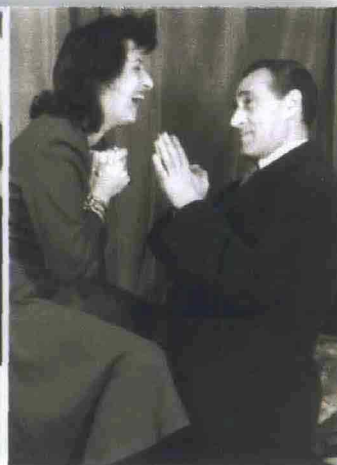
Tre scatti che raccontano una carriera. Da sinistra: la Magnani con Burt Lancaster in La rosa tatuata ; con Aldo Fabrizi in Roma città aperta ; al fianco di Totò, al tempo dell'avanspettacolo.