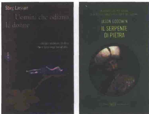
Stig Larsson Uomini che odiano le donne Marsilio, Venezia, pp. 676, € 19,50