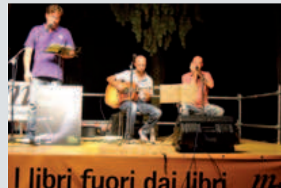
Un momento della manifestazione