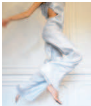
Un abito della collezione

In questi giorni le due stiliste si stanno preparando per portare i loro trenta capi, alla settimana della moda di Parigi, dal 3 al 7 ottobre, dove esporranno all'interno della fiera Zip Zone, presso lo showroom del