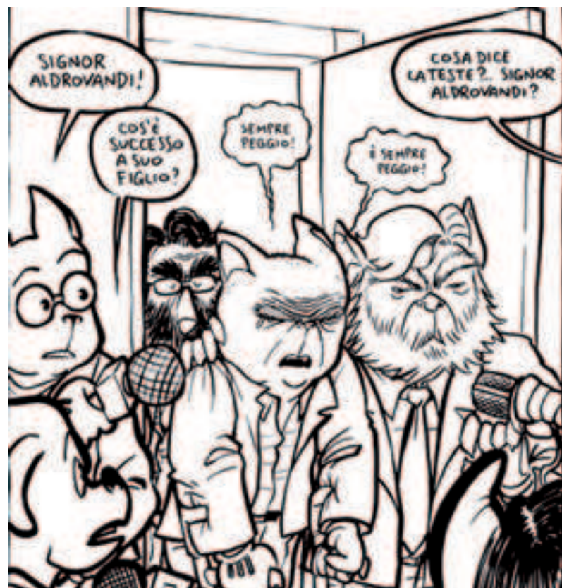
Una pagina del romanzo a fumetti

I personaggi antropomorfi del libro illustrato, poi, accentuano non solo il mistero della vicenda, ma evidenziano e rendono facilmente riconoscibili vizi e virtù di ogni personaggio. Così, in prestito da Orwell, i cattivi sono raffigurati come maiali che camminano su due zampe e i buoni sono