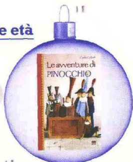
Le avventure di Pinocchio Carlo Collodi (Children's corner), pag. 200 € 13.00, Sarnus

A tutti i bambini regaliamo Le avventure di Pinocchio con le illustrazioni originali del 1881, un'edizione economica ma cartonata. Un classico tradizionale che forse ci dovrebbe essere in tutte le case, anche quelle senza bambini.