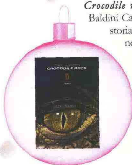
Crocodile rock Carl Hiaasen (Thriller), pag. 382, € 17.50 Meridiano zero

Un giornalista che fa necrologi inizia a indagare e scoprirà molte cose spiacevoli... rivisitando tutto il mondo del rock. È per tutti gli amanti del rock dagli anni '70 a oggi, e, naturalmente, per gli amanti del thriller.