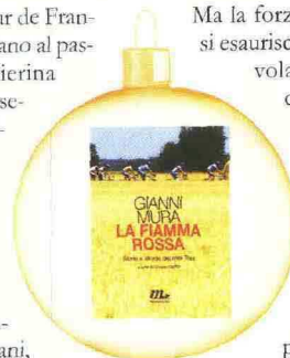
La fiamma rossa Storie e strade dei miei Tour Gianni Mura A cura di Simone Barillari, pag. 460, € 17.50, Minimum fax

Ma la forza della parola non si esaurisce nel ritratto di una volata, affonda nella carne e nel sudore, dà spessore a quella maglia gialla, e dona alla pagina una carica umana e letteraria che conquisterà anche i più scettici profani del ciclismo.