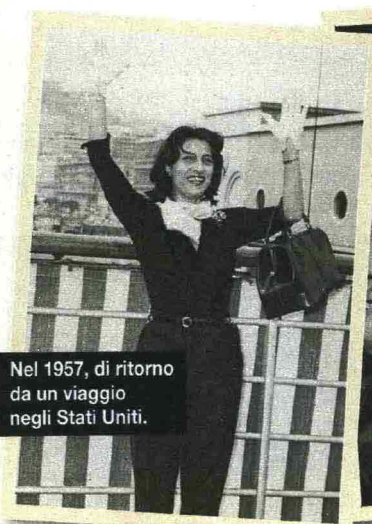
Nel 1957, di ritorno da un viaggio negli Stati Uniti.