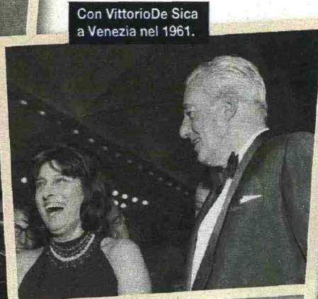
Con Vittorio De Sica a Venezia nel 1961.