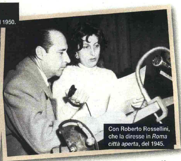
Con Roberto Rossellini, che la diresse in Roma città aperta, del 1945.