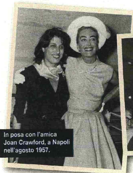
In posa con l'amica Joan Crawford, a Napoli nell'agosto 1957.