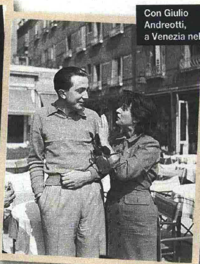
Con Giulio Andreotti, a Venezia nel 1950.