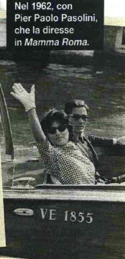
Nel 1962, con Pier Paolo Pasolini, che la diresse in Mamma Roma .