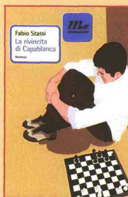
La rivincita di Capablanca di Fabio Stassi Minimum Fax Pag. 200 - Euro 11,50

Uno dei migliori esordi dell'ultima stagione letteraria, qui ripubblicato in nuova veste. Una raccolta dal grande valore letterario ed emotivo: vite che si intrecciano e si lasciano, la complessità dei rapporti umani raccontata con sguardo lucido.