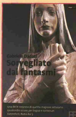
Sorvegliato dai fantasmi di Gabriele Dadati Barbera editore Pag. 206 - Euro 9,90