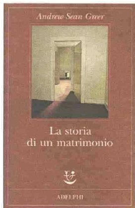
ANDREW SEAN GREER La storia di un matrimonio Adelphi