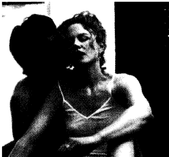
FERMO IMMAGINE Una scena da «Eyes Wide Shut» e, sopra, da «2001. Odissea nello spazio»