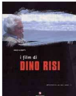
I FILM DI DINO RISI - IRENE MAZZETTI (Gremese)

Pioniere della commedia all'italiana, Dino Risi sfiora i temi tipici della nazione. Maestro nel coniugare gag, passione, verità, menefreghismo e satira. Rivoluzionario e sempre attuale, dà una svolta alla commedia all'italiana eliminando il lieto fine. E attraverso questa nuova propensione al dramma che cerca di liberarsi dalle accuse di qualunquismo. Il genio sapeva, però, di aver perso sensibilità e ironia. Ed è proprio con questa consapevolezza che l'8 giugno si spegneva. Di lui rimane solo il sorriso che ci lasciava sulle labbra. Spesso partiva dai libri, Risi, per sceneggiare una pellicola. Ed è proprio un libro a rendergli omaggio: "I film di Dino Risi". Il volume di Irene Mazzetti, storica del cinema, si apre con un'introduzione in cui viene analizzata l'attività del regista, per poi focalizzare l'attenzione sulla sua filmografia completa. Ogni scheda è stilata con particolare cura per i dettagli, integrata da immagini e recensioni dell'epoca. Il testo è agile, rivolto agli appassionati e a chi ha voglia di conoscere meglio Dino Risi e il modo in cui ha segnato il cinema italiano.